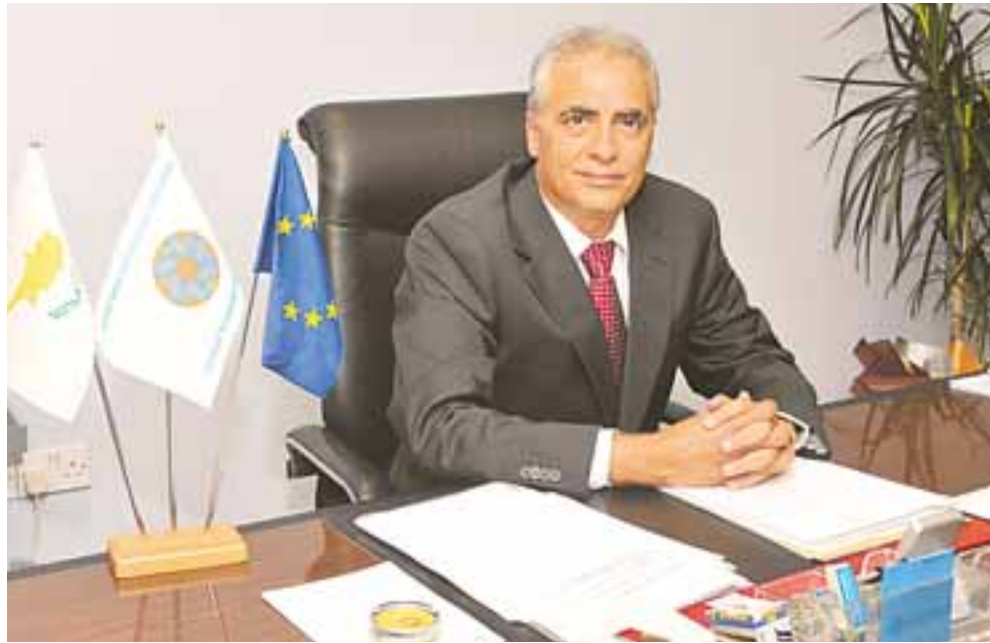
Δύσκολο το έργο που καλείται να επιτελέσει ο πρόεδρος του ΚΟΤ...