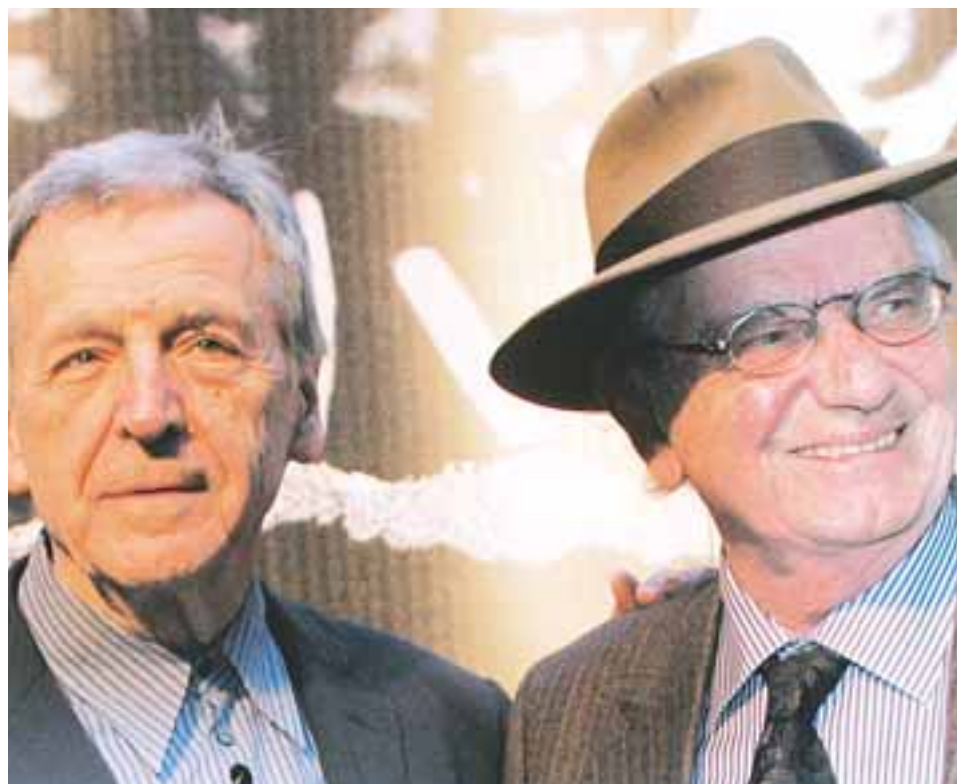
Ο σκηνοθέτης του «Z» Κώστας Γαβράς και ο συγγραφέας του βιβλίου Βασίλειος Βασιλικός συνομιλούν κατά τη διάρκεια εκδήλωσης αφιερωμένης στην ταινία «Z», στην έναρξη του 10ου Φεστιβάλ Γαλλόφωνου Κινηματογράφου, στο Γαλλικό Ινστιτούτο, την Τετάρτη 1 Απριλίου 2009.

Ναι, εγώ ήμουν νόμιμος μετανάστης, πήγα για να δουλέψω και να σπουδάσω. Την εποχή εκείνη ήταν εύκολο να δουλέψεις οι φοιτητές. Ήταν ευχάριστη εποχή διότι είχαμε την ελπίδα για το μέλλον. Σήμερα τα παιδιά δεν ελπίζουν στο μέλλον διότι παντού βλέπουν προβλήματα. Νέοι με 3-4 διπλώματα είναι άνεργοι ή βρίσκουν δουλειά με 700 ευρώ το μήνα. Πώς θα ζήσουν; Δεν υπάρχει ελπίδα σήμερα, αυτό είναι το τρομερό, γι' αυτό κατεβάζουμε στο δρόμο και τα σπάνε όλα. Το τραγικό είναι ότι δεν έχω καμιά συμβουλή να τους δώσω.