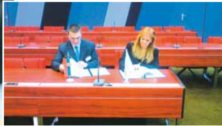
Από την υπογραφή Μνημονίου Συνεργασίας μεταξύ των Μονάδων Κύπρου και Σερβίας

Στόχος η αποστέρηση των εγκληματιών από το κίνητρο παράνομων εσόδων