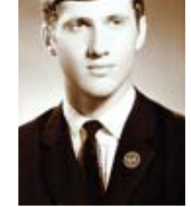
Διαπρέψασε τη μνήμη για το Λευκόνικο αλλά και την Αμμόχωστο.