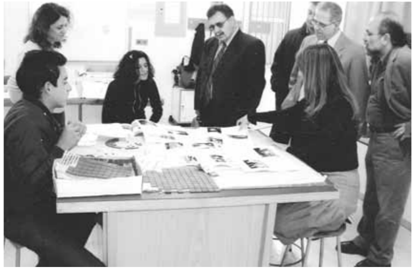
Αριστερά: Σε συνέδριο για τα ναρκωτικά στη Φινλανδία το 2002. Πάνω: Σε Γυμνάσιο της Λεμεσού της Ζώνης Εκπαιδευτικής Προτεραιότητας σε δράση κατασκευής ψηφιδωτού τοίχου από ομάδα παιδιών του σχολείου. Δεξιά: Σε συνέδριο στην Ισπανία για τα ναρκωτικά το 2003.