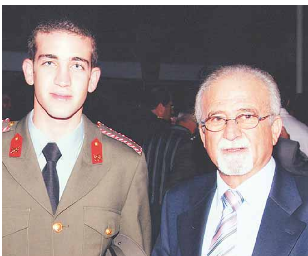
Με το γιο του Πολυνεϊκής το Μάρτιο του 2008.

Σας συμβούλευε; Η ίδια η ζωή του Μακαρίου ήταν μια συμβολή και ένα σύμβολο αγώνων. Απλά αντλούσα και αντλώ δύναμη από το έργο του.