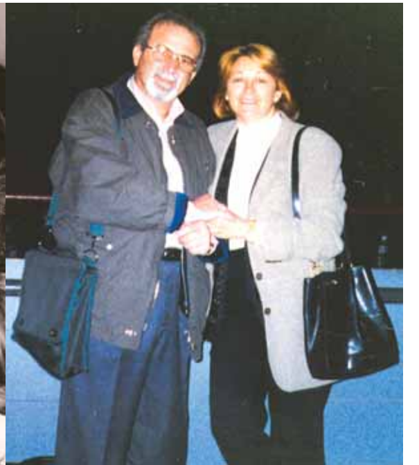
Με τη σύζυγό του Κική το 1981.