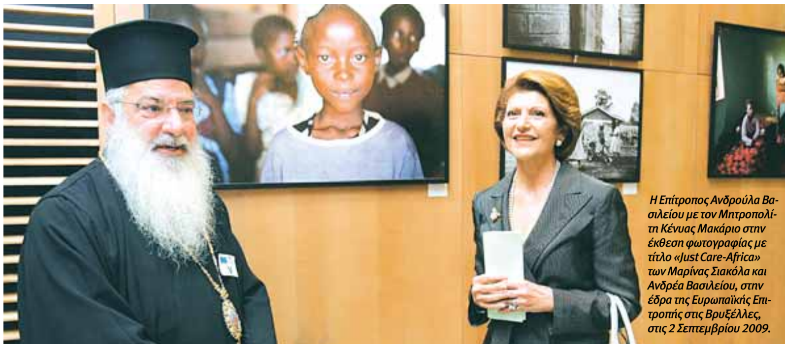
Η Επίτροπος Ανδρούλα Βασιλείου με τον Μητροπολίτη Κένυας Μακάριο στην έκθεση φωτογραφίας με τίτλο «Just Care-Africa» των Μαρίας Σιακόλα και Ανδρέα Βασιλείου, στην έδρα της Ευρωπαϊκής Επιτροπής στις Βρυξέλλες, στις 2 Σεπτεμβρίου 2009.

Συναντηθήκαμε στο σπίτι του στη Λεμεσό, στις εννιά το βράδυ. Ο Μητροπολίτης Κένυας Μακάριος, ο κατά κόσμον Ανδρέας Πηλλυρίδης, εκτός από το σημαντικό ιεραποστολικό έργο που επιτελεί στην Αφρική, εκτός από την αγάπη του για τη μουσική, έχει ένα αξιόλογο ερευνητικό και συγγραφικό έργο. Όνεργό του, να ιδρύσει το πρώτο Ορθόδοξο Πανεπιστήμιο της Αφρικής.