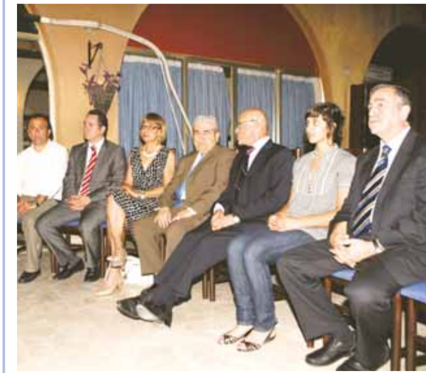
Εκδήλωση στο Λήδρα Πάλας στην παρουσία του προέδρου Χριστόφια και του Μεχμέτ Αλί Ταλάτ για να τιμηθούν οι αρχηγοί που πήραν μέρος στη συνάντηση της Πράγας το 1989.

τον κύκλο που γυρίζουν. Είναι η πρώτη φορά που οι ηγέτες των δυο κοινοτήτων μιλούν, είναι φίλοι, όταν διαφανούν συναντώνται μόνοι και προσπαθούν να βρουν μια λύση. Ναι, μέχρι τώρα βρήκαν λύσεις, αλλά όχι στα σημαντικά θέματα. Από την άλλη, δεν μπορούν όλα να λυθούν αμέσως. Πολλά πράγματα θα βρουν το δρόμο τους από τη στιγμή που θα ζούμε και θα δουλεύουμε μαζί κάτω από την ομπρέλα της ομοσπονδίας. Γιατί να μην αφήσουμε τα πράγματα να εξελιχθούν; Προσπαθούν να δώσουν λύσεις σε όλα λόγω της κακής εμπειρίας του παρελθόντος. Έχουν καχυποψία και οι δυο πλευρές, είναι ανθρωπινο λόγω των λαθών που έγιναν στην Ιστορία. Οι πρόσφατες εκταções των πέντε αγνοουμένων Ελληνοκυπρίων στρατιωτών, οι οποίοι συνελήφθησαν στο Τζιάος από Τούρκους στρατιώτες και εκτελέστηκαν... Είναι πράγματι λυπηρό, αλλά δεν είναι μόνο η μια πλευρά που έκανε τέτοια πράγματα και δεν το λέω για να υποτιμήσω αυτά που συνέβηκαν στους πέντε στρατιώτες. Νιώθω βαθιά θλίψη και αισθάνομαι το πένθος των οικογενειών τους. Στην Ιστορία μας δυστυχώς υπάρχουν τέτοια περιστατικά, γι' αυτό κάποια στιγμή είναι εισηγηθεί να γίνει ένα κοινό μνημείο για τους αγνοουμένους, αλλά κανείς δεν νοιάστηκε. Το καλύτερο πράγμα που ίσως έκανε ο κ. Ταλάτ και αυτό πρέπει να το παραδεχτούμε είναι ότι αντιμετώπισε το θέμα των αγνοουμένων ως ανθρωπιστικό μαζί με την ελληνοκυπριακή ηγεσία.