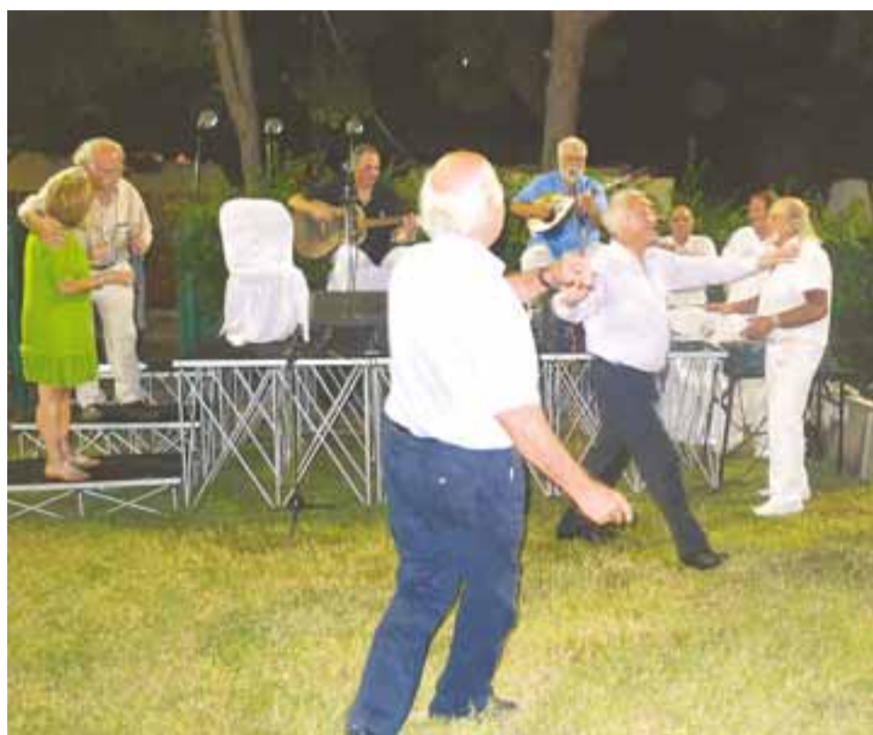
Στα εγκαίνια της Γιορτής του Κρασιού στη Λεμεσό, την Παρασκευή 28 Αυγούστου 2009. Ο υπουργός Εμπορίου και Βιομηχανίας Αντώνης Παπαλιθής χορεύει υπό τους ήχους του τραγουδιού του Λέλλου Δημητριάδη και τη χειροκροτήματα των Μουσταφά Ακιντζί και Δημήτρου Αντρέα Χριστού.